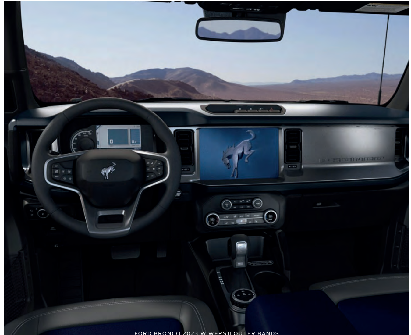
FORD BRONCO 2023 W WERSJI OUTER BANKS