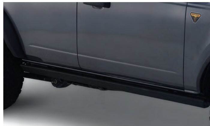
ZESTAW WZMOCNIENI OCHRONNYCH WZDŁUŻ PROGÓW DRZWI 3 400,- (TYLKO WERSJA OUTER BANKS)