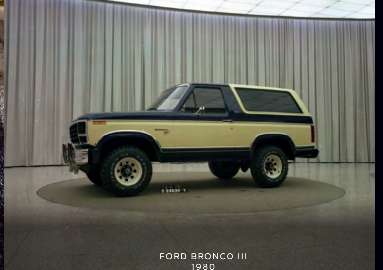
FORD BRONCO III 1980