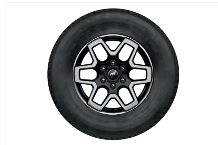
18" OBRĘCZE KÓŁ ZE STOPÓW LEKKICH, OGUMIENIE A/T 255/70 Standard dla wersji OUTER BANKS