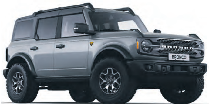
CARBONIZED GREY - LAKIER METALIZOWANY 5 700,-