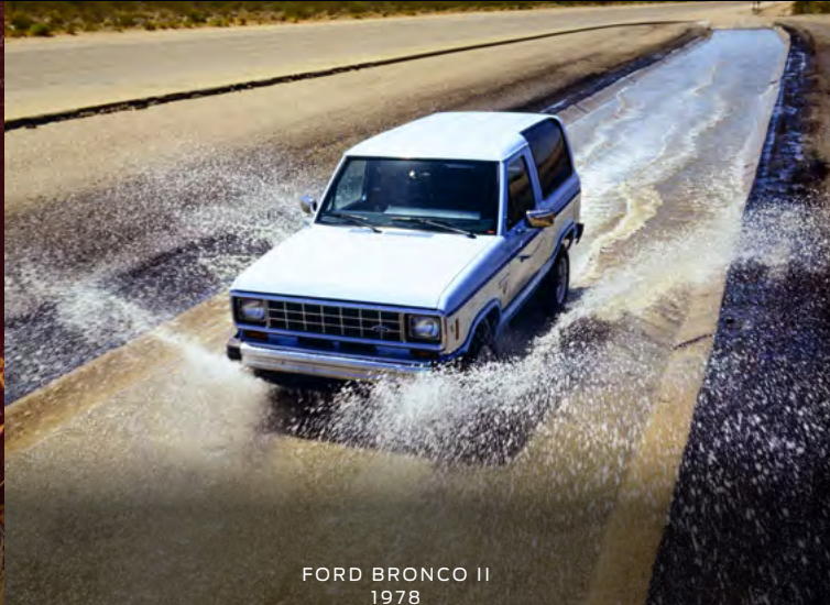
FORD BRONCO II 1978