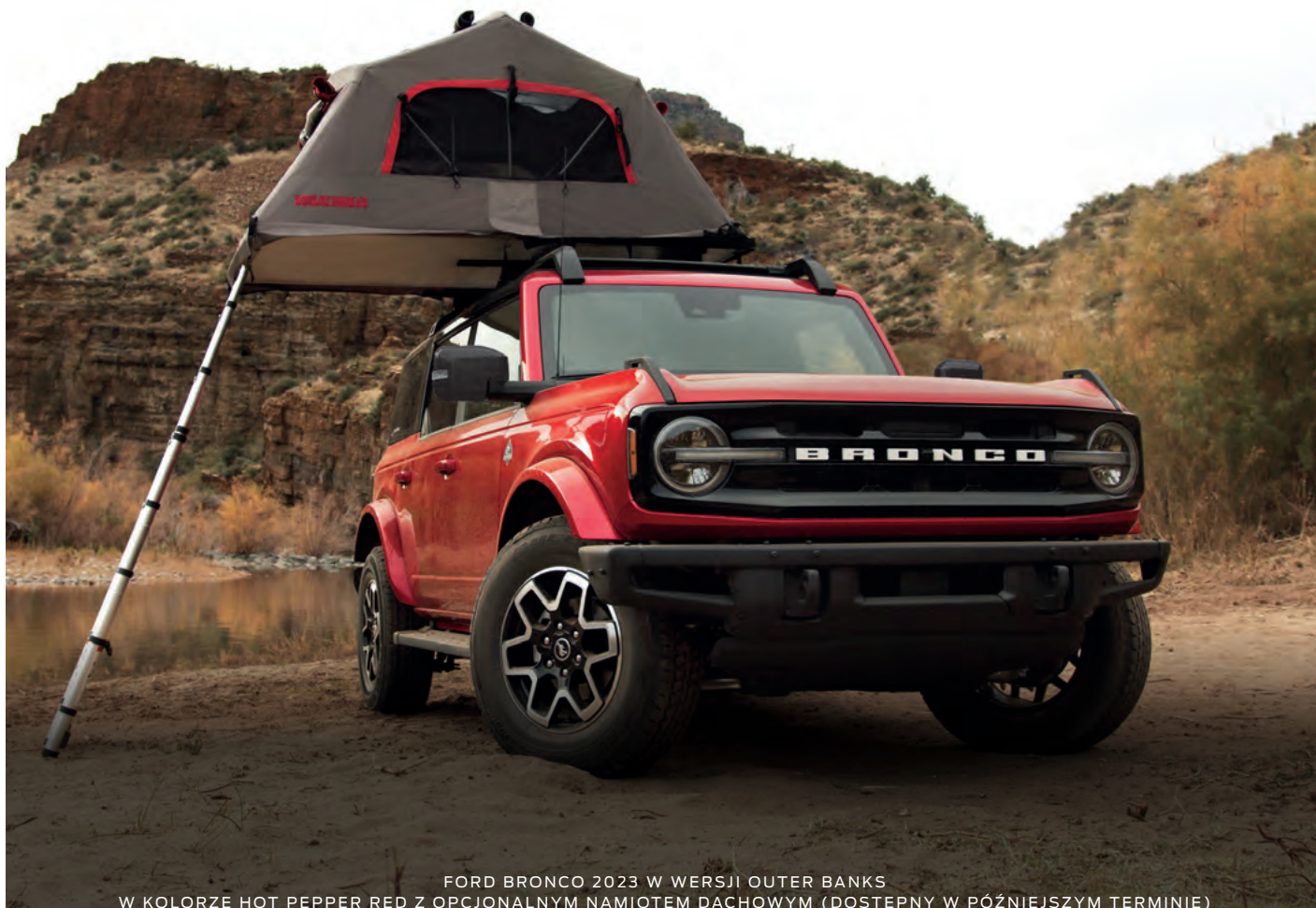
FORD BRONCO 2023 W WERSJI OUTER BANKS W KOLORZE HOT PEPPER RED Z OPCJONALNYM NAMIOTEM DACHOWYM (DOSTĘPNY W PÓŹNIEJSZYM TERMINIE)