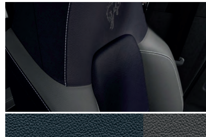
TAPICERKA SKÓRZANA W TONACJI DARK SPACE GREY Standard dla wersji OUTER BANKS

NOWY FORD BRONCO OUTER BANKS Z LAKIEREM ZWYKŁYM FROZEN WHITE (OPCJA) (ilustracje mogą nieznacznie różnić się od wersji produkcyjnej)