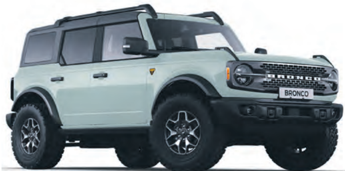
CACTUS GREY - LAKIER SPECJALNY 6 700,-