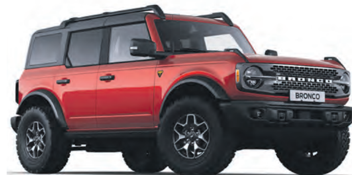
HOT PEPPER RED - LAKIER METALIZOWANY SPECJALNY 6 700,-