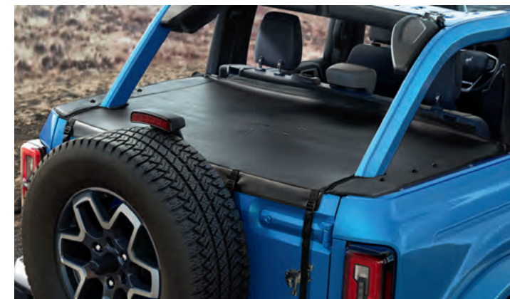
WINYLOWA POKRYWA BAGAŻNIKA, ODPORNA NA WARUNKI POGODOWE 801,-