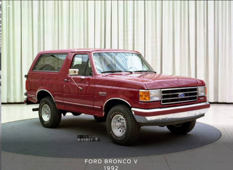
FORD BRONCO V 1992