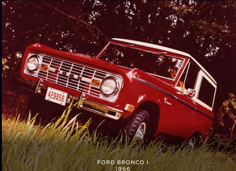
FORD BRONCO I 1966