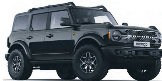
ABSOLUTE BLACK - LAKIER SPECJALNY 5 700,-