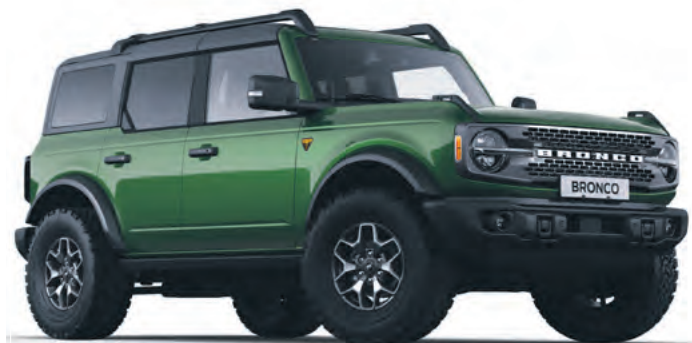
ERUPTION GREEN - LAKIER METALIZOWANY 5 700,-