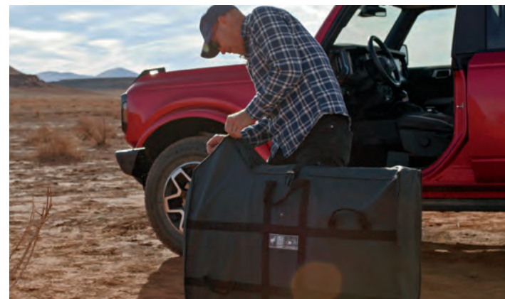
TORBY OCHRONNE NA DRZWI (DRZWI PRZEDNIE) 1 574,-