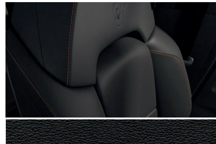
TAPICERKA SKÓRZANA W TONACJI BLACK ONYX Standard dla wersji BADLANDS

NOWY FORD BRONCO BADLANDS Z LAKIEREM ZWYKŁYM ERUPTION GREEN (OPCJA) (ilustracje mogą nieznacznie różnić się od wersji produkcyjnej)