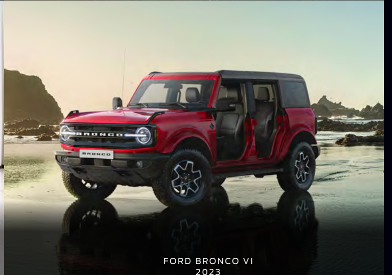
FORD BRONCO VI 2023