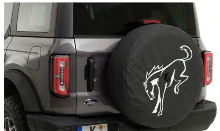
OSŁONA KOŁA ZAPASOWEGO Z LOGO BRONCO 1 064,-