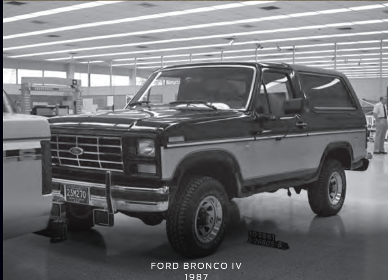
FORD BRONCO IV 1987