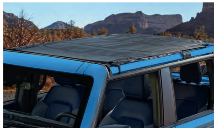
ROLETA PRZECIWSŁONECZNA (SIATKOWA) UMOŻLIWIA JAZDĘ Z OTWARTYM DACHEM, CHRONIĄC PRZED OSTRYM SŁOŃCEM. 3 629,-