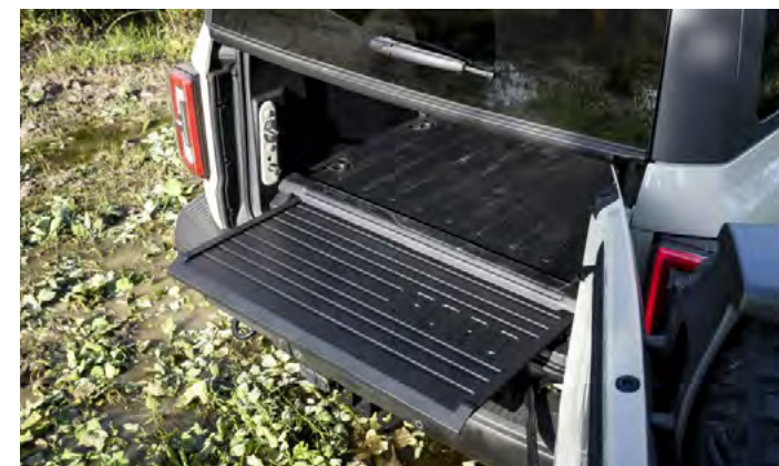
WYSUWANY STOPIEŃ POD PODŁOGĄ DRZWI BAGAŻNIKA