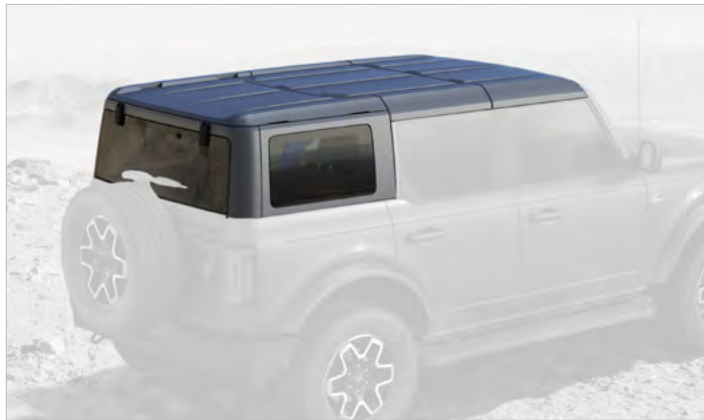
DACH HARDTOP W KOLORZE CARBONIZED GREY Standard