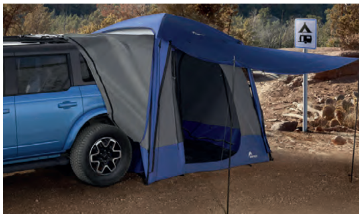
NAMIOT DOŁĄCZANY DO TYLNEJ CZĘŚCI NADWOZIA 2 600,-