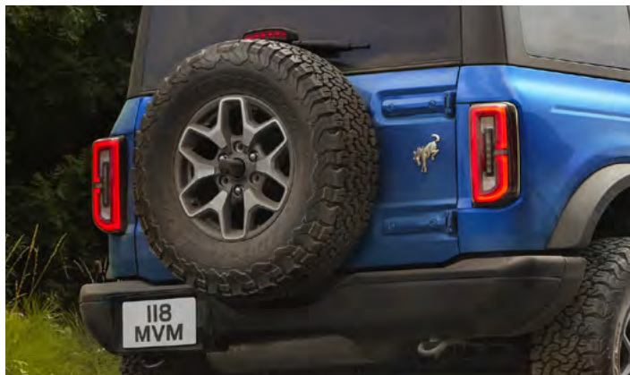
KOŁO ZAPASOWE NA TYLNEJ KLAPIE Standard