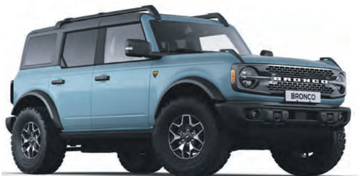
AREA 51 - LAKIER SPECJALNY 6 700,-