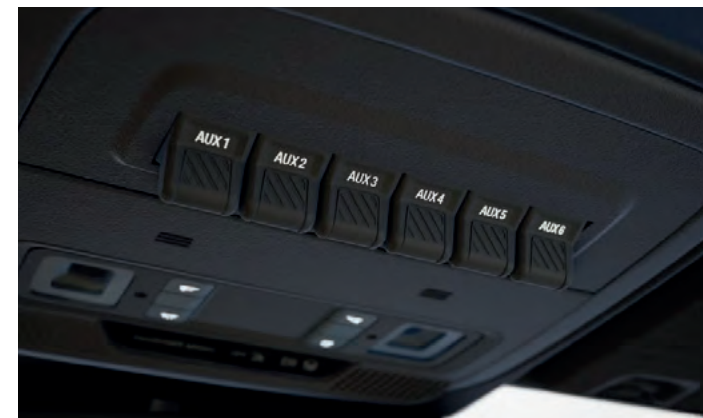
KONSOLA DACHOWA Z PRZEŁĄCZNIKAMI DO PODŁĄCZENIA DODATKOWYCH URZĄDZEŃ