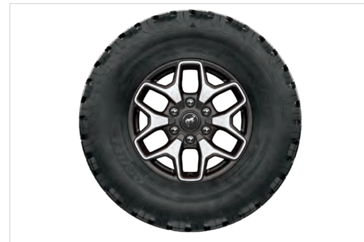
17" OBRĘCZE KÓŁ ZE STOPÓW LEKKICH, OGUMIENIE A/T 285/70 Standard dla wersji BADLANDS