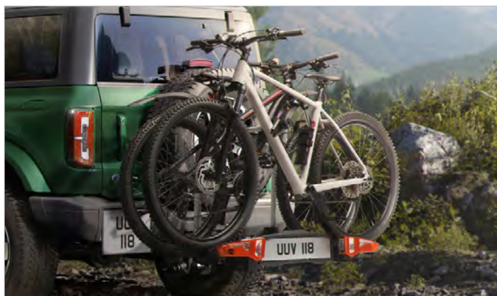
BAGAŻNIK ROWEROWY MOCOWANY NA HAKU 2 448,-