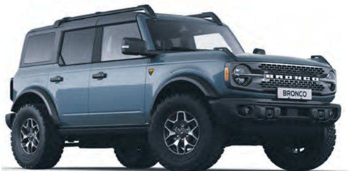
AZURE GREY - LAKIER METALIZOWANY SPECJALNY 6 700,-