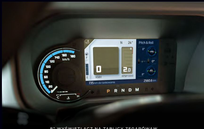
8" WYŚWIETLACZ NA TABLICY ZEGARÓWAW