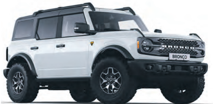
OXFORD WHITE - LAKIER ZWYKŁY bez dopłaty