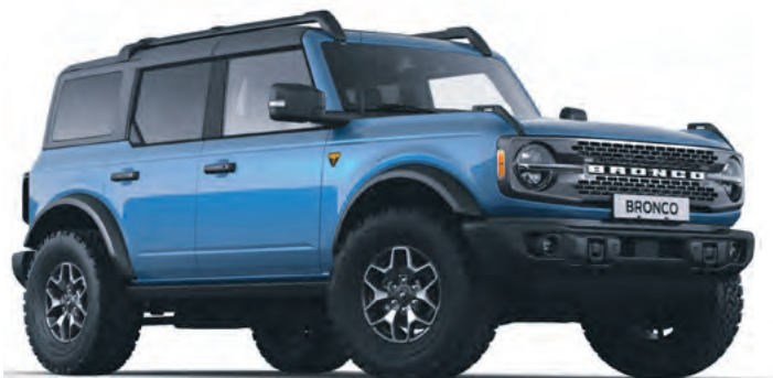
VELOCITY BLUE - LAKIER METALIZOWANY 6 700,-