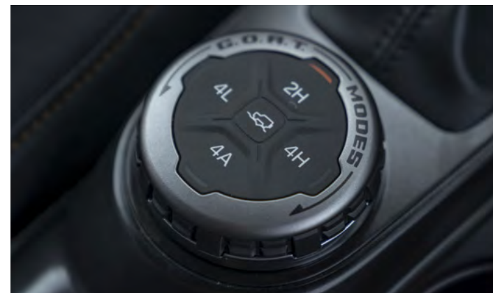
TERRAIN MANAGEMENT SYSTEM™ - SYSTEM WYBORU TRYBU JAZDY Standard