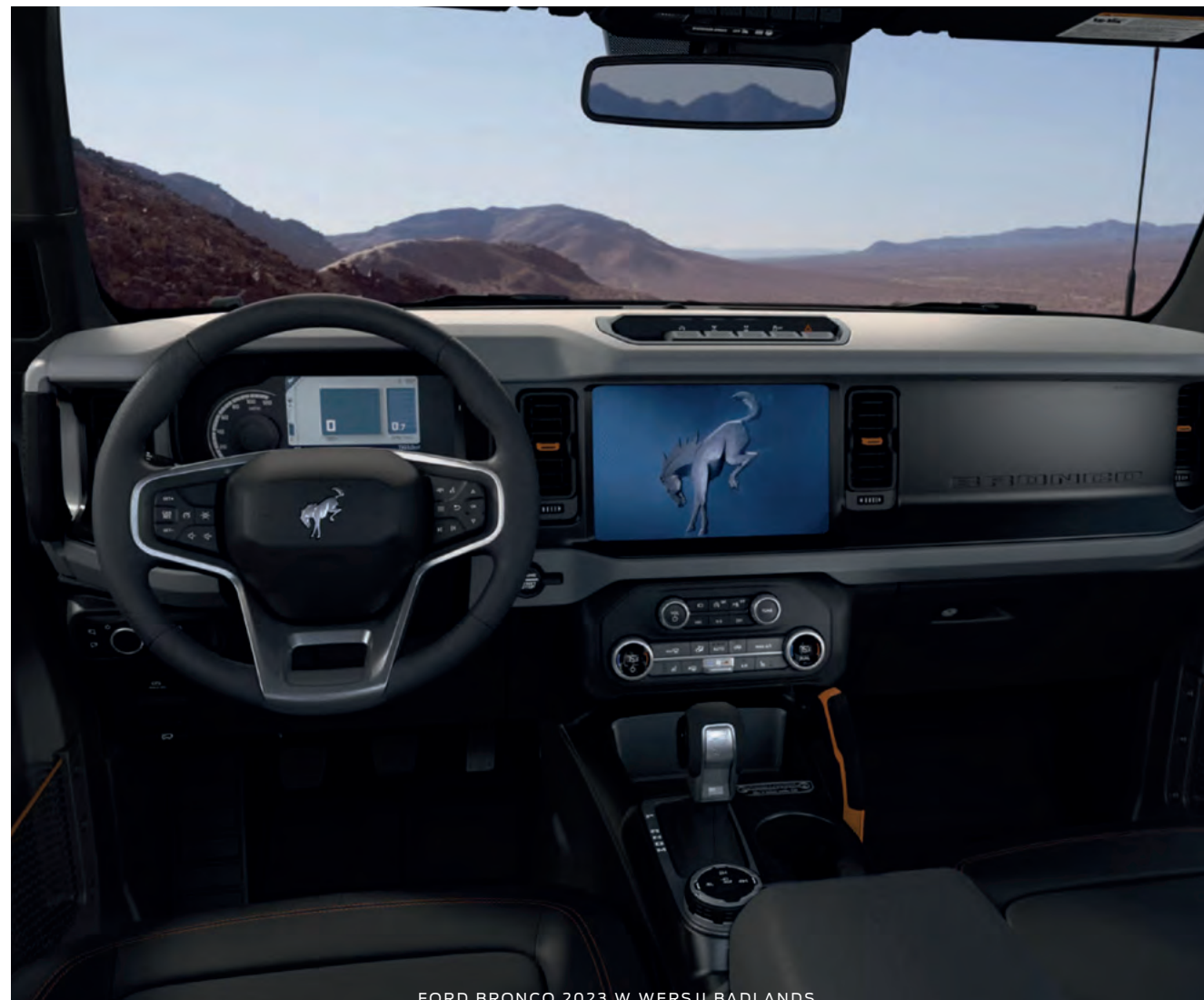
FORD BRONCO 2023 W WERSJI BADLANDS