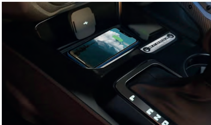
BEZPRZEWODOWA ŁADOWARKA DO SMARTFONÓW Standard