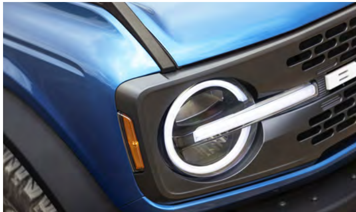
REFLEKTORY W TECHNOLOGII LED Standard